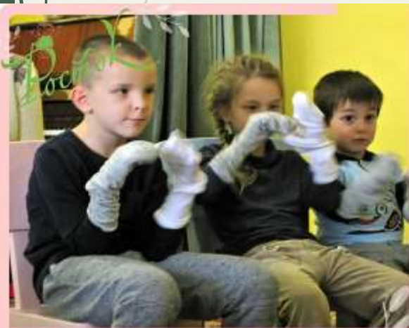
КУРС ВОССТАВЛЯЮЩЕЙ ПЕДАГОГИКИ ДЛЯ ДЕТЕЙ С ОВЗ ЛОГОПЕД