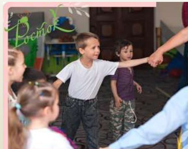
КУРС ВОССТАВЛЯЮЩЕЙ ПЕДАГОГИКИ ДЛЯ ДЕТЕЙ С ОВЗ КРУГ ДРУЗЕЙ