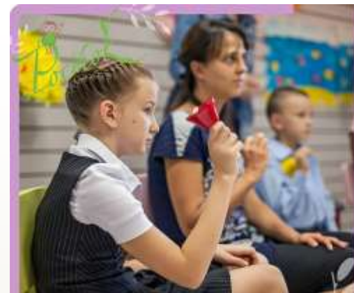
АКАДЕМИЯ РАЗВИТИЯ ТВОРЧЕСКОГО ПОТЕНЦИАЛА МУЗЫКАЛЬНОЕ ОТДЕЛЕНИЕ