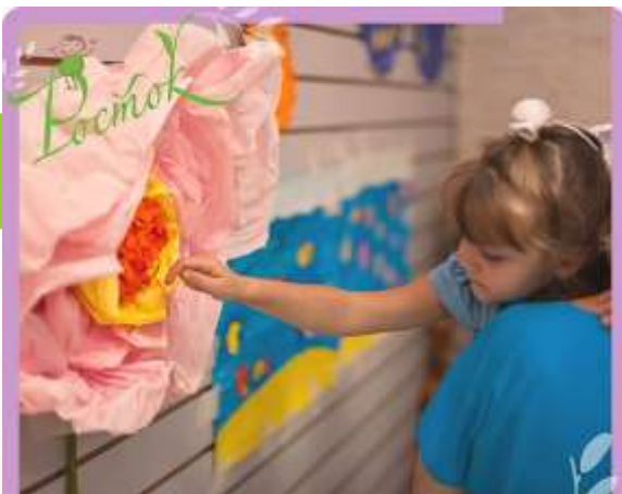
АКАДЕМИЯ РАЗВИТИЯ ТВОРЧЕСКОГО ПОТЕНЦИАЛА ОБЩЕ-ЭСТЕТИЧЕСКОЕ ОТДЕЛЕНИЕ