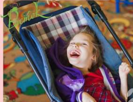
КУРС ВОССТАВЛЯЮЩЕЙ ПЕДАГОГИКИ ДЛЯ ДЕТЕЙ С ОВЗ ИНТЕНСИВ