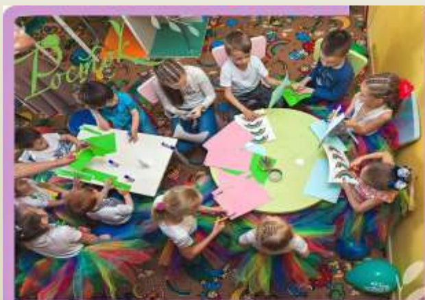
АКАДЕМИЯ РАЗВИТИЯ ТВОРЧЕСКОГО ПОТЕНЦИАЛА ОТДЕЛЕНИЯ ПО ТРЕМ НАПРАВЛЕНИЯМ